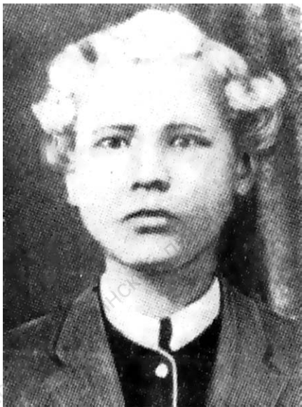
Е.Ф. Карский в детстве