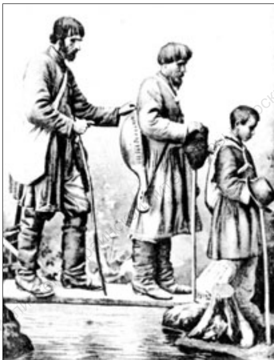
Слепцы-бандуристы (Нежинская открытка)