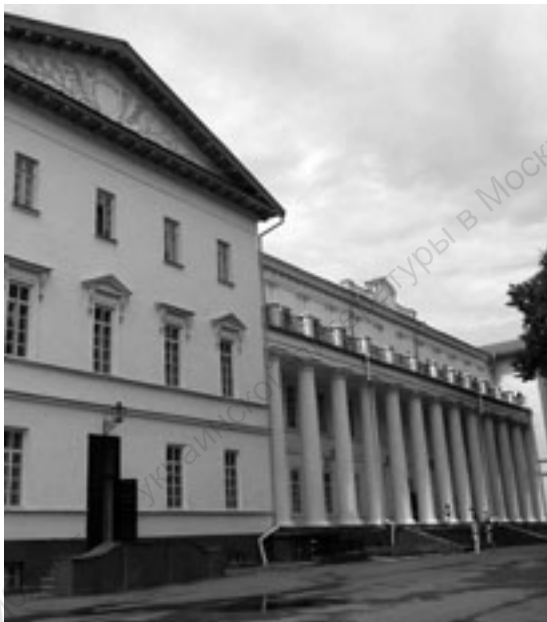
Гоголевский (главный) корпус Нежинского государственного университета имени Николая Гоголя