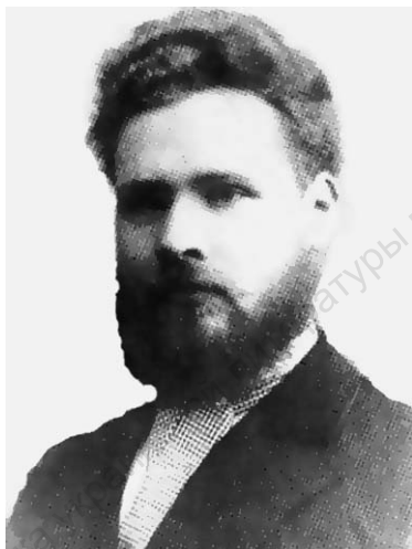
Евфимий Федорович Карский (20.XII.1860 [1.I.1861], с. Лаша Гродненской губернии – 29.IV.1931, Ленинград)