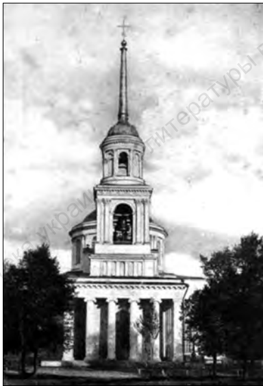
Орел. Петропавловский собор

А.И. Булгаков оценивал критически, не слишком лестно упоминал некоторых из учителей, которых, впрочем, защищал перед товарищами, идя «против всех».