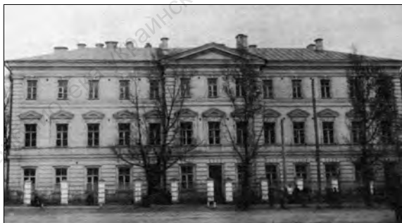
Новый корпус Киевской духовной академии (начало XX века)

пределов Российской империи, но и из дальних стран, в их числе болгары, сербы, румыны, греки, японцы, различные арабы и другие. Десятую часть студентов Академии составляли иностранцы, причем большее их число, также как и в случае с представителями Российской империи, являлось выходцами из семей священно- и церковнослужителей.