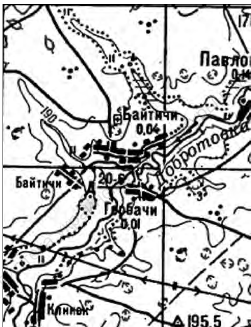
Карта с. Байтичи и его окрестностей