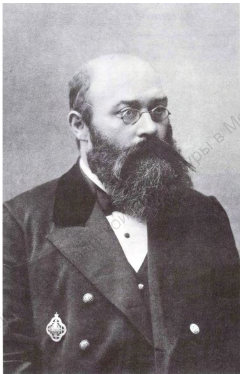
Профессор Афанасий Иванович Булгаков