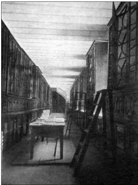
Библиотека Киевской духовной академии (начало XX века)