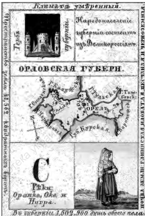
«Визитная карточка» Орловской губернии