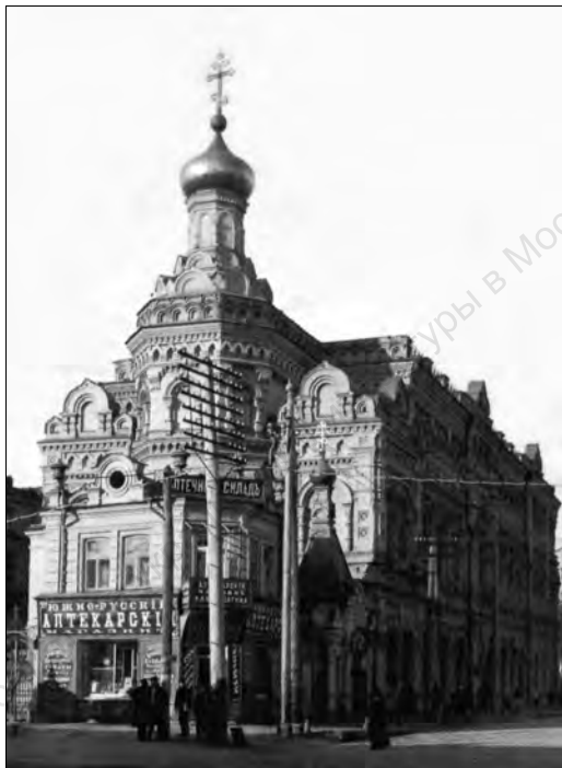
Здание Киевского религиозно-просветительного общества (фото начала XX века)