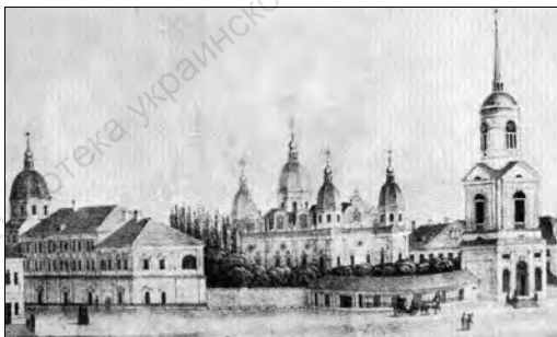
Братский Богоявленский монастырь и Киевская духовная академия (1840-е гг.)

Выпускник «Орловской духовной семинарии Афанасий Булгаков, предназначенный правлением семинарии к отправлению в Киевскую духовную академию», после сдачи соответствующих испытаний, летом 1881 года стал полноправным казеннокоштным студентом ее Церковно-исторического отделения и был поселен в академическом корпусе.