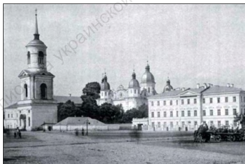
Киевская духовная академия (1880-е годы)

Киевская духовная академия располагалась на Подоле при Братском Богоявленском монастыре, настоятелем которого были ее ректоры, викарии Киевской епархии. За каменной оградой монастыря находилась соборная Богоявленская церковь, старый академический корпус с расположенной в нем Благовещенской церковью, Святодуховская церковь, братские кельи и новый академический корпус.