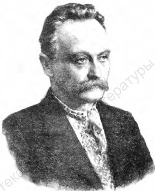
Иван Яковлевич Франко (Родился 27 августа 1856 г. в с. Нагуевичи, ныне Дрогобычский район Львовской области; скончался 28 мая 1916 г. в г. Львове)