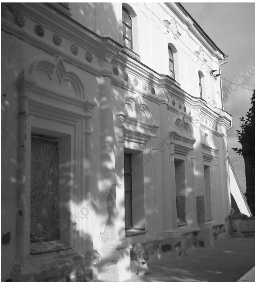
Здание типографии Киево-Печерской лавры, в которой печатались издания Киево-Могилянской академии (фото 2006 г.)