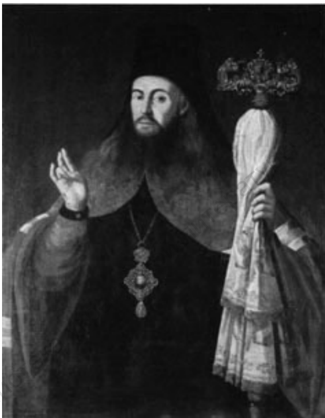
Киевский митрополит Самуил Миславский (1731–1796)